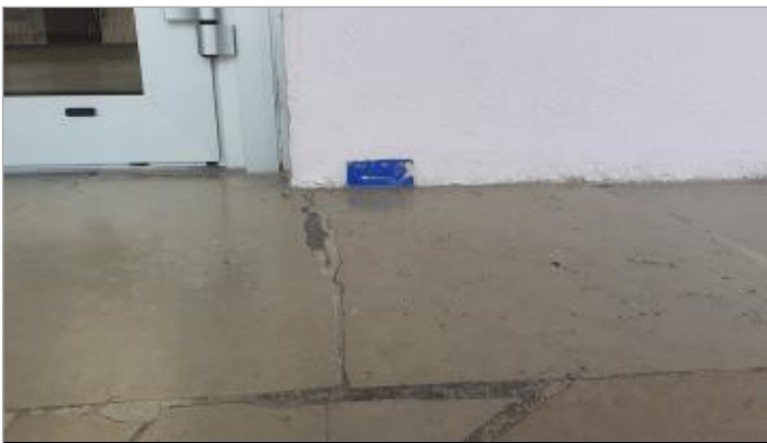
Vue rapprochée du repère dans le sas d'entrée