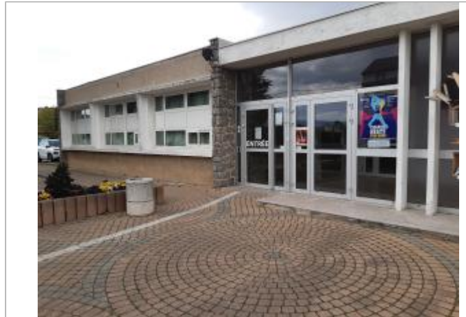
Foyer Laurent Bouvier. Un repère est installé dans une salle, en intérieur