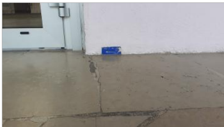
Vue rapprochée du repère dans le sas d'entrée