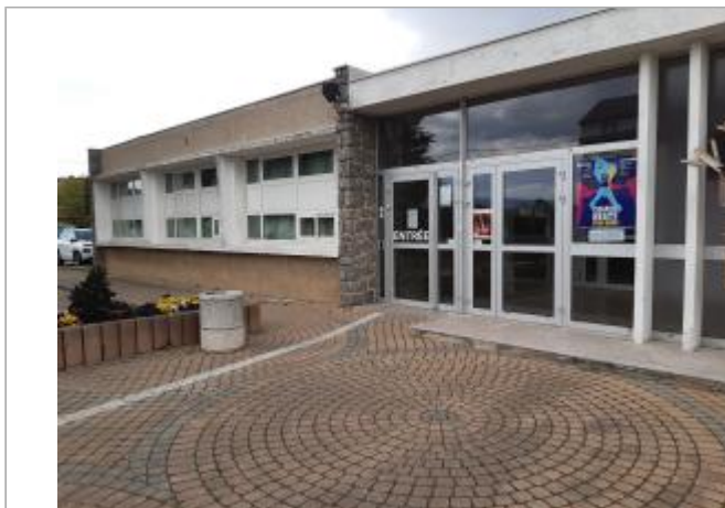
Foyer Laurent Bouvier. Un repère est installé dans une salle, en intérieur