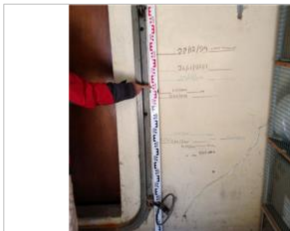
Marque sur le mur