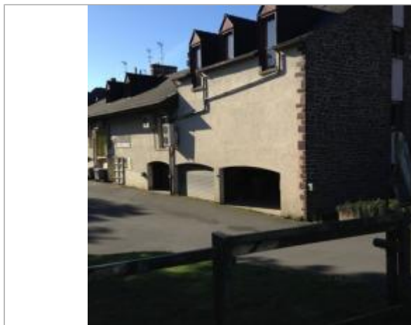
Parking atelier réparation proximi - garage