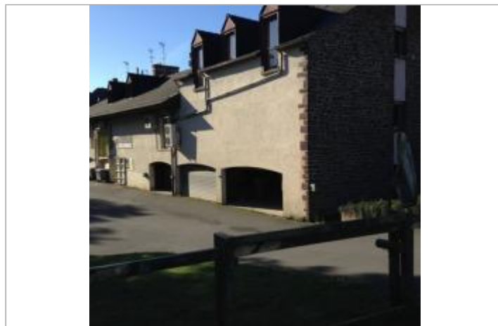
Parking atelier réparation proxî - garage