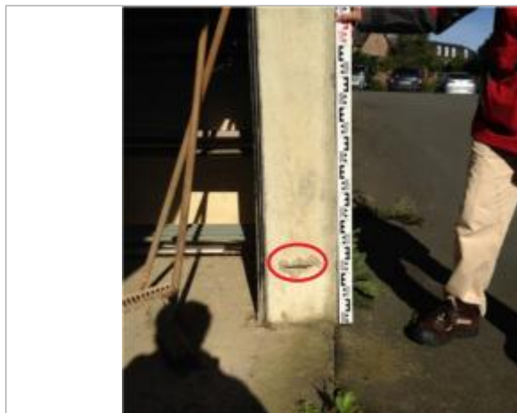
Marque gravée sur poteau béton