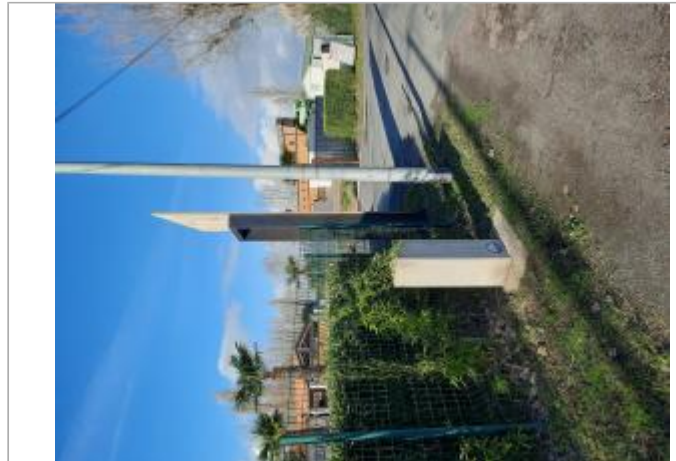
Entrée du camping, sur la D747

Coordonnées WGS84 : X: -1.41382120 / Y: 46.37209300