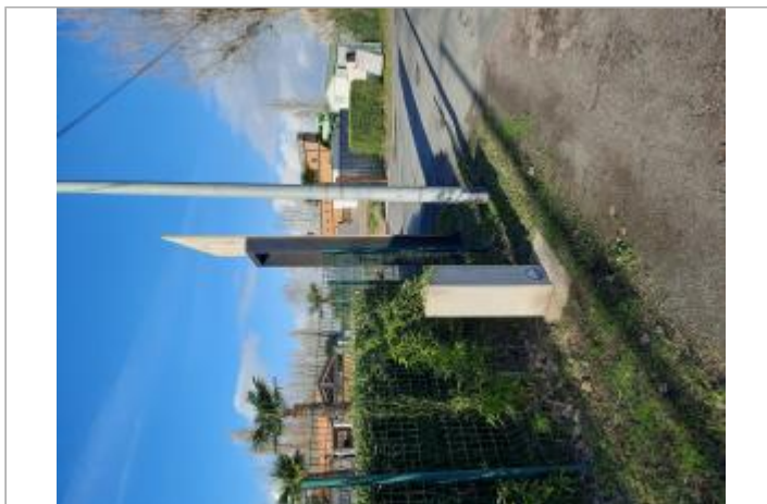
Entrée du camping, sur la D747