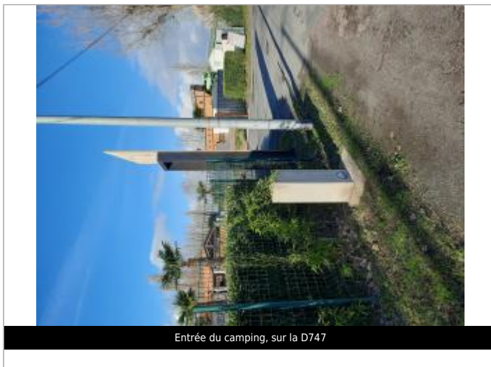
Entrée du camping, sur la D747