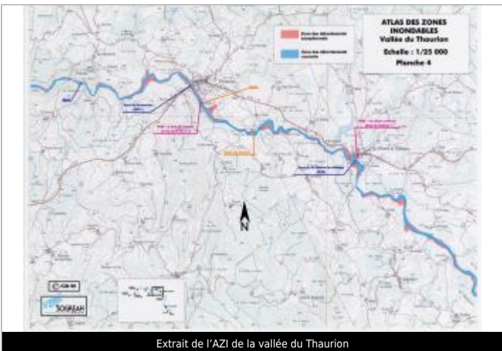
Extrait de l'AZI de la vallée du Taurion

GÉOLOCALISATION Coordonnées WGS84 : X: 1.84974910 / Y: 45.99277470 Coordonnées RGF93 (Lambert 93) : X: 610970.15 / Y: 6544319.95 Coordonnées RGF93 (ETRS89) : X: 1.8497491 / Y: 45.9927747 Code Hydro: L0-0150 Rive de référence: Non renseigné