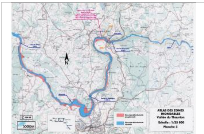
Extrait de l'AZI de la vallée du Thaurion

Code : AZI_DDT23_R_63_4 Date de mise à jour : 27/04/2022 Auteur : msemery