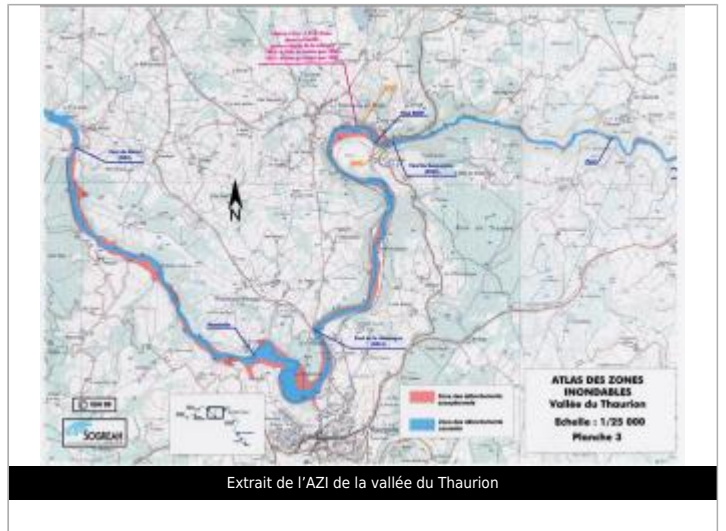
Extrait de l'AZI de la vallée du Taurion

GÉOLOCALISATION Coordonnées WGS84 : X: 1.76281018 / Y: 45.99822870 Coordonnées RGF93 (Lambert 93) X: 604251.07 / Y: 6545027.27 Coordonnées RGF93 (ETRS89) : X: 1.7628102 / Y: 45.9982287 Code Hydro: L0-0150 Rive de référence: Non renseigné