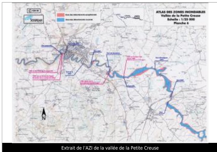
Extrait de l'AZI de la vallée de la Petite Creuse