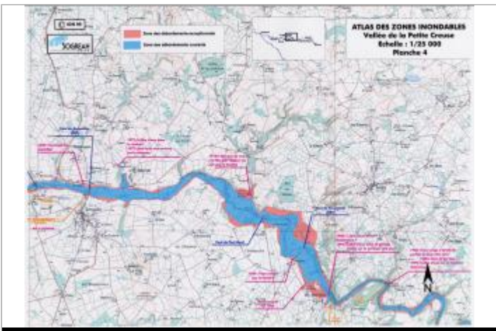
Extrait de l'AZI de la vallée de la Petite Creuse