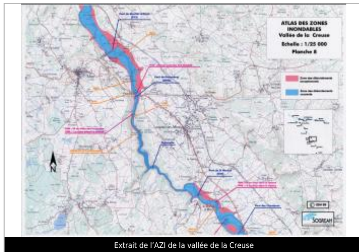
Extrait de l'AZI de la vallée de la Creuse

GÉOLOCALISATION Coordonnées WGS84 : X: 2.06694695 / Y: 46.07472260 Coordonnées RGF93 (Lambert 93) X: 627888 / Y: 6553197.89 Coordonnées RGF93 (ETRS89) : X: 2.066947 / Y: 46.0747226 Code Hydro: L---0070 Rive de référence: Non renseigné