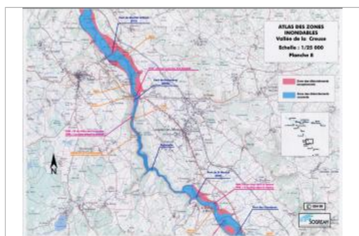
Extrait de l'AZI de la vallée de la Creuse

GÉNÉRAL Code : AZI_DDT23_R_29_2 Date de mise à jour : 27/04/2022 Auteur : msemery