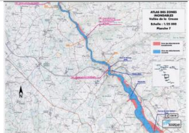
Extrait de l'AZI de la vallée de la Creuse