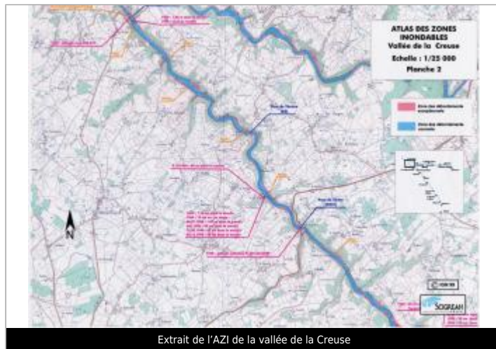
Extrait de l'AZI de la vallée de la Creuse

GÉOLOCALISATION Coordonnées WGS84 : X: 1.72902824 / Y: 46.33639280 Coordonnées RGF93 (Lambert 93) X: 602241.26 / Y: 6582617.51 Coordonnées RGF93 (ETRS89) : X: 1.7290282 / Y: 46.3363928 Code Hydro: L---0070 Rive de référence: Non renseigné