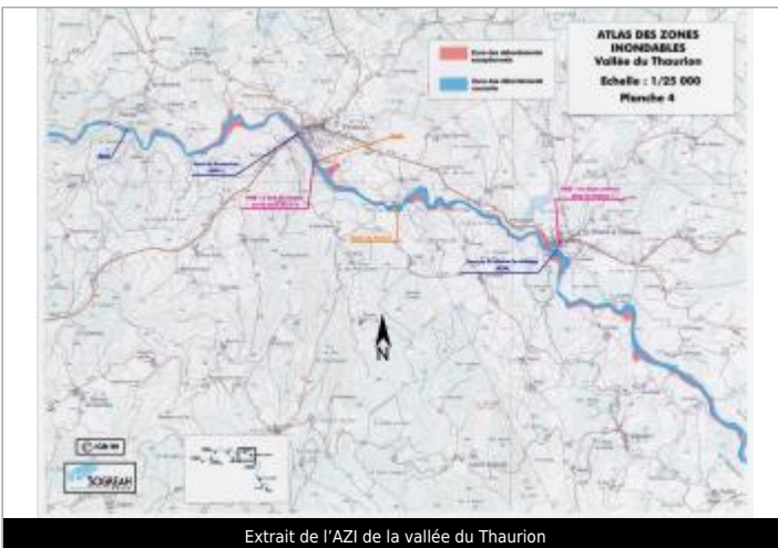
Extrait de l'AZI de la vallée du Taurion

GÉOLOCALISATION Coordonnées WGS84 : X: 1.84974910 / Y: 45.99277470 Coordonnées RGF93 (Lambert 93) X: 610970.15 / Y: 6544319.95 Coordonnées RGF93 (ETRS89) X: 1.8497491 / Y: 45.9927747 Code Hydro: L0-0150 Rive de référence: Non renseigné