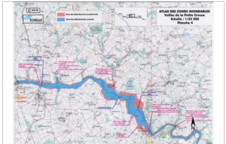
Extrait de l'AZI de la vallée de la Petite Creuse

Coordonnées WGS84 : X: 1.99377064 / Y: 46.35762020