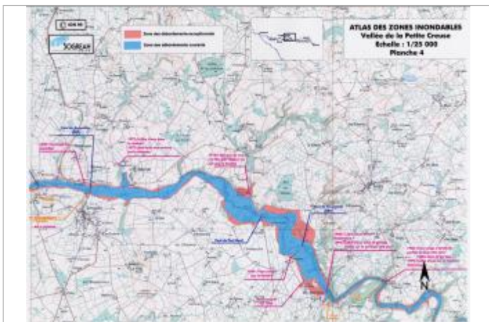
Extrait de l'AZI de la vallée de la Petite Creuse