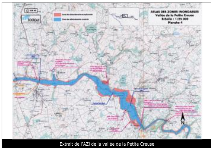
Extrait de l'AZI de la vallée de la Petite Creuse