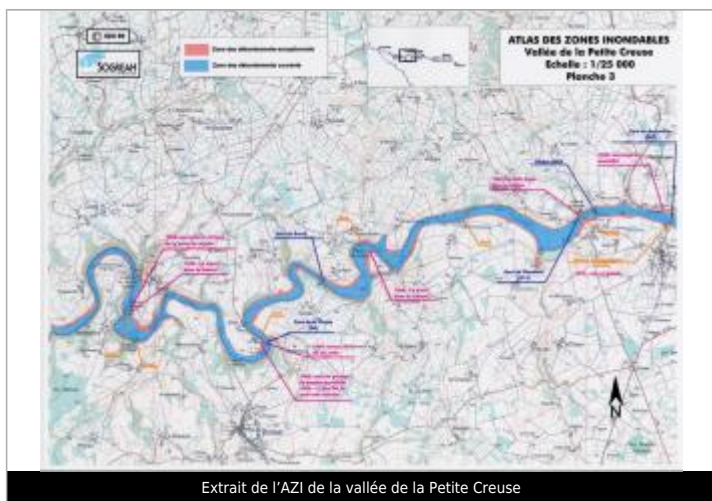
Extrait de l'AZI de la vallée de la Petite Creuse