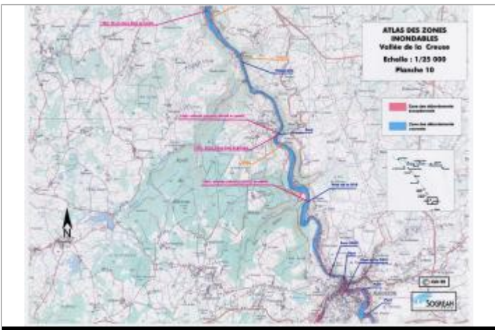
Extrait de l'AZI de la vallée de la Creuse

GÉOLOCALISATION Coordonnées WGS84 : X: 2.14707952 / Y: 45.98685780 Coordonnées RGF93 (Lambert 93) X: 633975.49 / Y: 6543371 Coordonnées RGF93 (ETRS89) : X: 2.1470795 / Y: 45.9868578 Code Hydro: L---0070 Rive de référence: Non renseigné