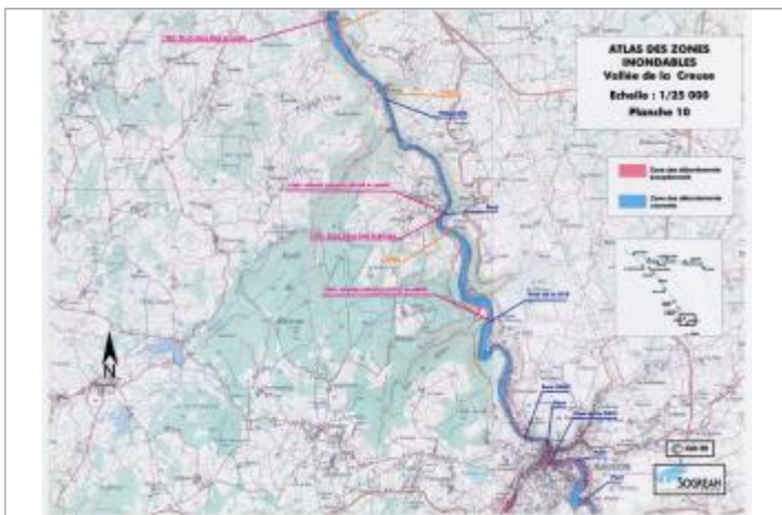
Extrait de l'AZI de la vallée de la Creuse