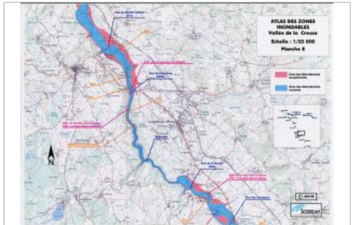
Extrait de l'AZI de la vallée de la Creuse