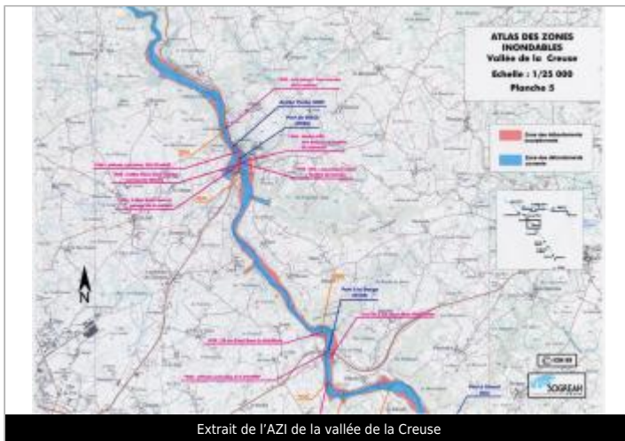
Extrait de l'AZI de la vallée de la Creuse

GÉOLOCALISATION Coordonnées WGS84 : X: 1.93874924 / Y: 46.19533400 Coordonnées RGF93 (Lambert 93) X: 618160.68 / Y: 6566715.82 Coordonnées RGF93 (ETRS89) : X: 1.9387492 / Y: 46.195334 Code Hydro: L---0070 Rive de référence: Non renseigné