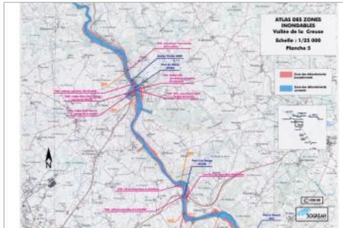
Extrait de l'AZI de la vallée de la Creuse