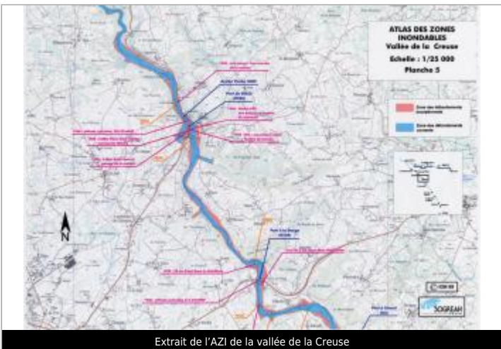
Extrait de l'AZI de la vallée de la Creuse

GÉOLOCALISATION Coordonnées WGS84 : X: 1.91990658 / Y: 46.22254010 Coordonnées RGF93 (Lambert 93) X: 616749.02 / Y: 6569756.52 Coordonnées RGF93 (ETRS89) : X: 1.9199066 / Y: 46.2225401 Code Hydro: L---0070 Rive de référence: Non renseigné