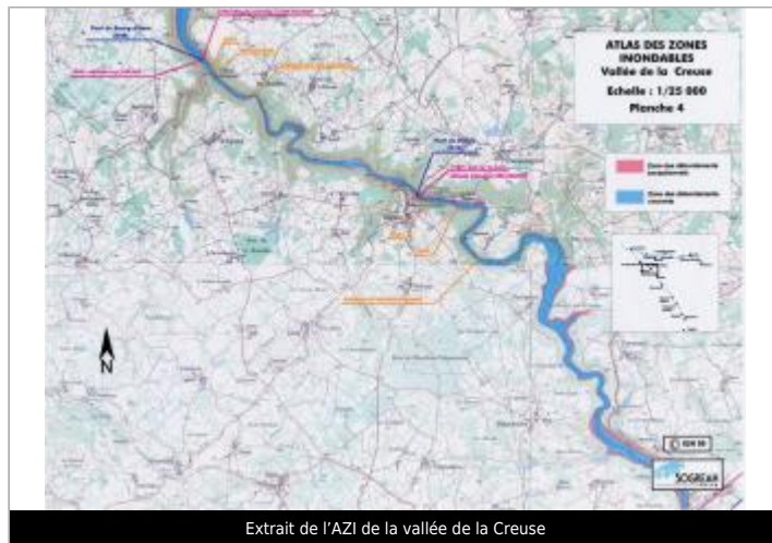
Extrait de l'AZI de la vallée de la Creuse

GÉOLOCALISATION Coordonnées WGS84 : X: 1.86539072 / Y: 46.26865080 Coordonnées RGF93 (Lambert 93) X: 612620.93 / Y: 6574935.59 Coordonnées RGF93 (ETRS89) : X: 1.8653907 / Y: 46.2686508 Code Hydro: L---0070 Rive de référence: Non renseigné