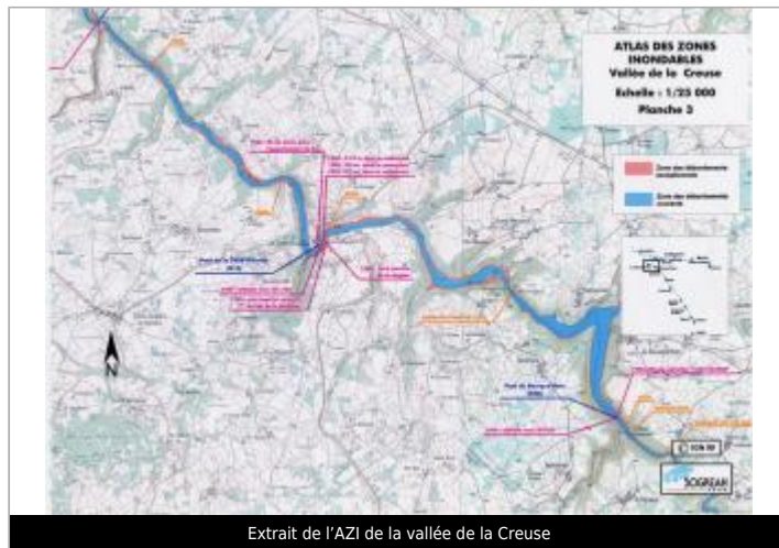
Extrait de l'AZI de la vallée de la Creuse

GÉOLOCALISATION Coordonnées WGS84 : X: 1.82517042 / Y: 46.28623450 Coordonnées RGF93 (Lambert 93) X: 609552.74 / Y: 6576933.38 Coordonnées RGF93 (ETRS89) X: 1.8251704 / Y: 46.2862345 Code Hydro: L---0070 Rive de référence: Non renseigné