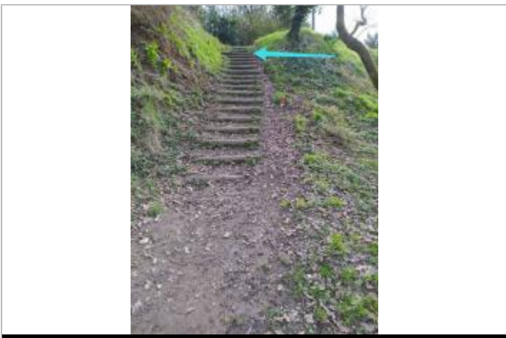
Photo depuis le sentier, 2022

GÉOLOCALISATION Coordonnées WGS84 : X: 0.63475300 / Y: 47.38658900 Coordonnées RGF93 (Lambert 93) : X: 521586.11 / Y: 6701144.32 Coordonnées RGF93 (ETRS89) : X: 0.634753 / Y: 47.386589 Code Hydro : ----0000 Rive de référence: Gauche