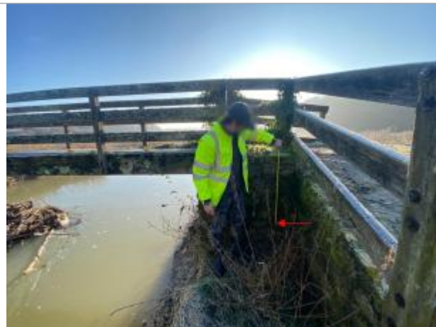
Vue site - Auteur : SYAGE