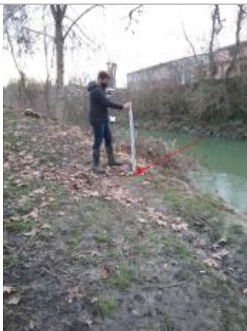
Vue marque