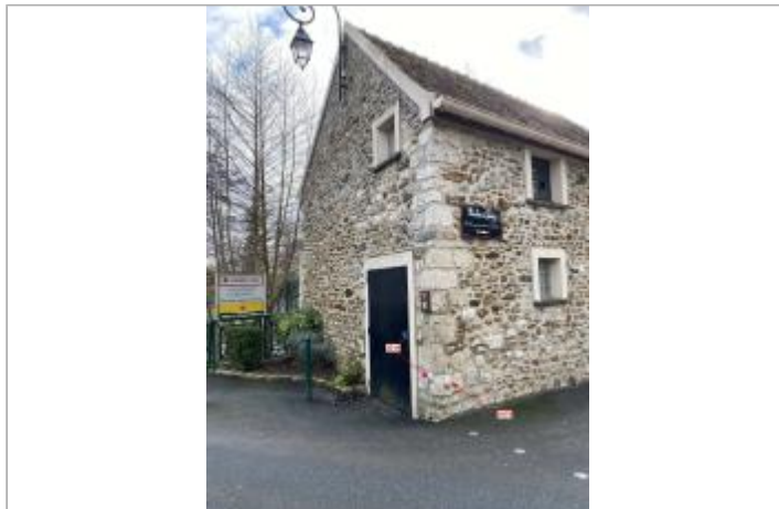
Vue site