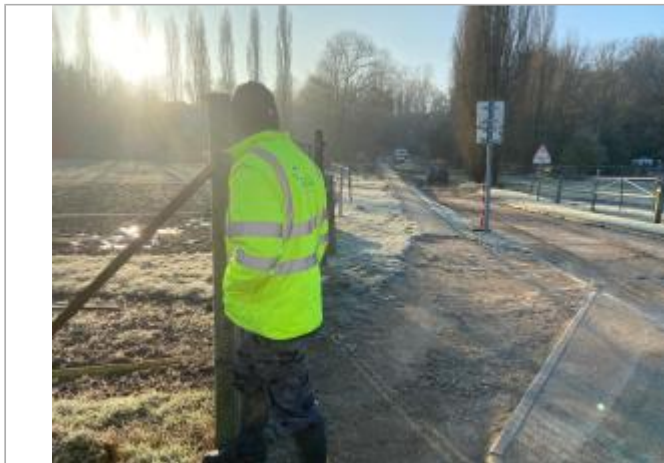
Vue site - Auteur : SYAGE