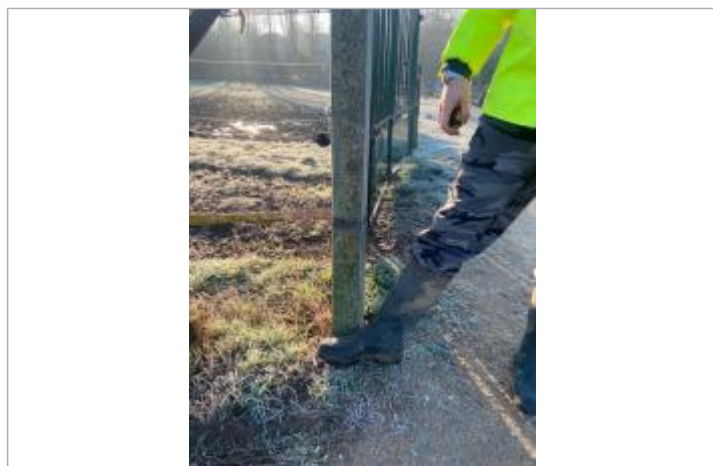
Vue marque - Auteur : SYAGE

Altitude calculée de l'eau (en m) : 61.96 m