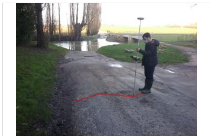
Vue marque - Auteur : SPC SMYL