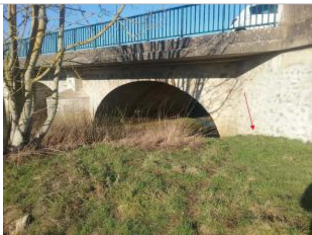
Vue marque - Auteur : SPC SMYL

Altitude calculée de l'eau (en m) : 67.26 m