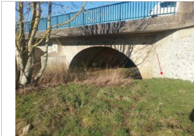
Vue site - Auteur : SPC SMYL

Coordonnées WGS84 : X: 2.77194380 / Y: 48.64855350