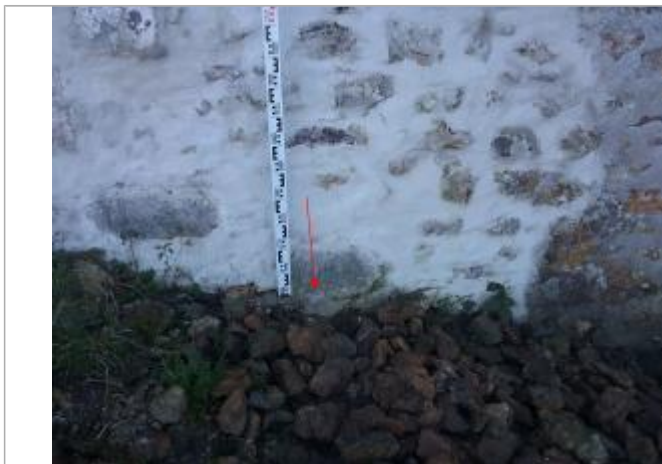
Vue marque - Auteur : SPC SMYL