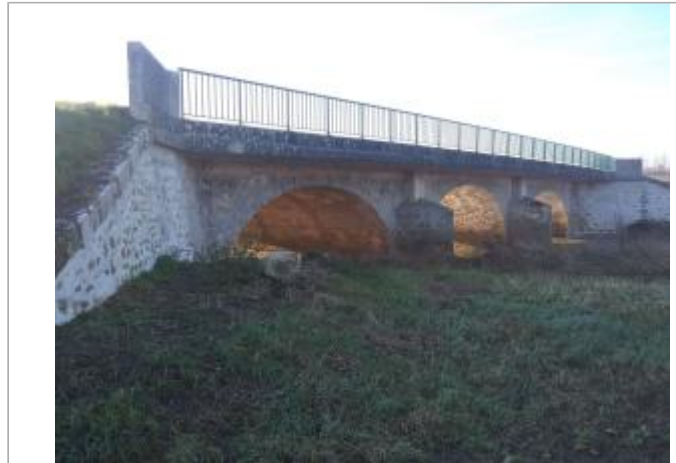
Vue site - Auteur : SPC SMYL