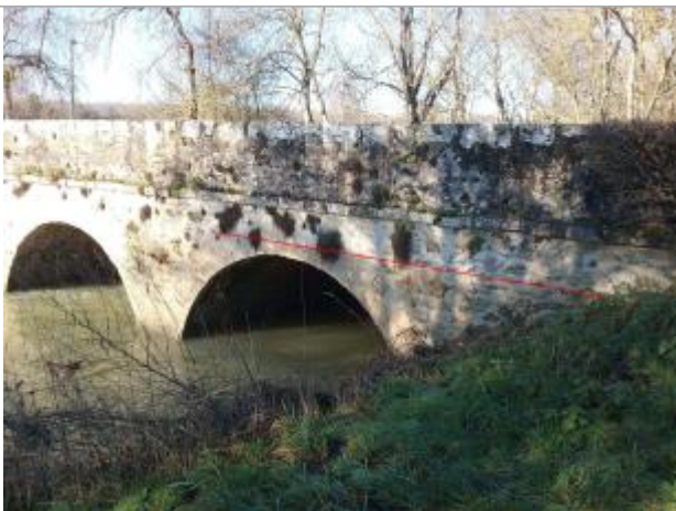
Vue marque - Auteur : SPC SMYL

Organisme : SPC Seine moyenne - Yonne - Loing