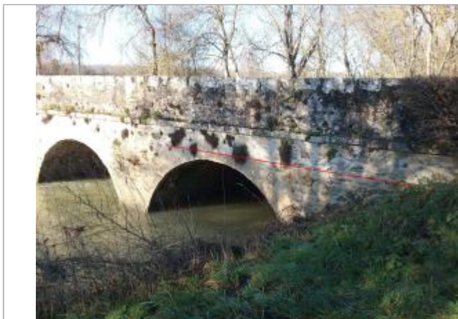
Vue site - Auteur : SPC SMYL