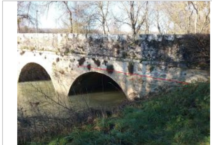
Vue site