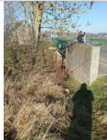
Vue site