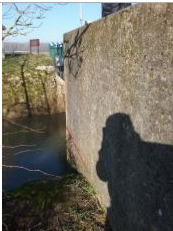
Vue marque - Auteur : SPC SMYL