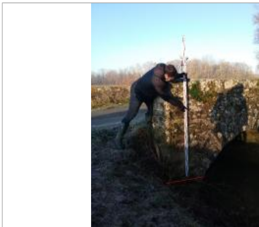
Vue marque - Auteur : SPC SMYL