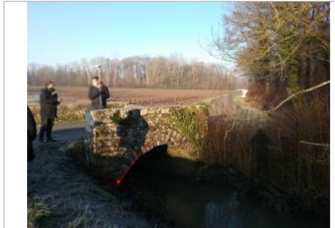
Vue site - Auteur : SPC SMYL