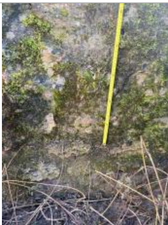
Vue marque - Auteur : SYAGE

Organisme : SPC Seine moyenne - Yonne - Loing