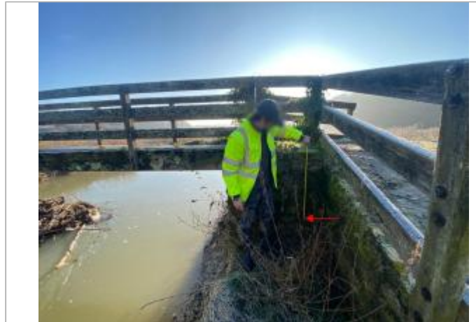
Vue site

Coordonnées WGS84 : X: 2.78777310 / Y: 48.66048700