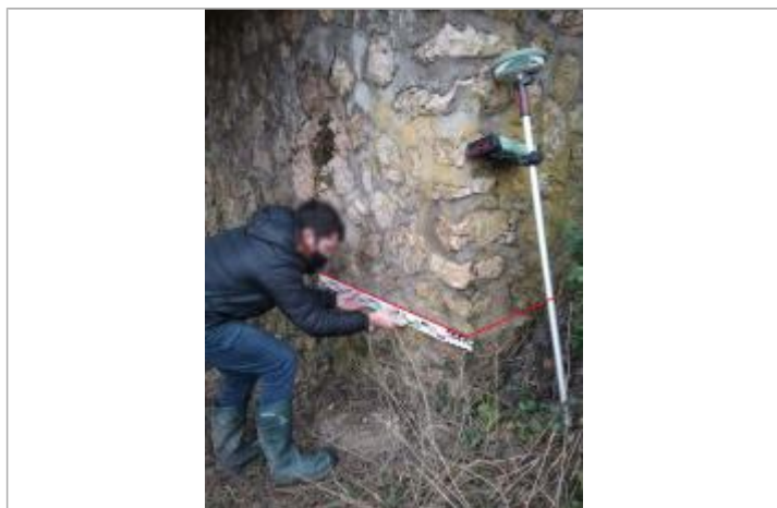
Vue marque

Altitude calculée de l'eau (en m) : 53.77