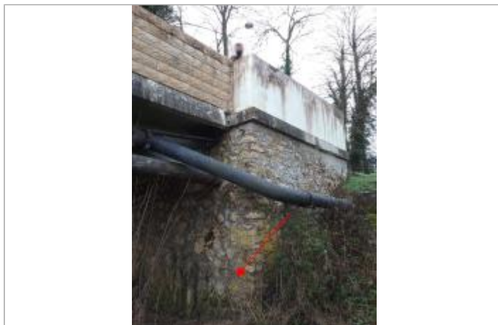
Vue site - Auteur : SPC SMYL