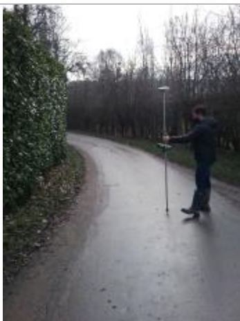
Vue marque - Auteur : SPC SMYL

Altitude calculée de l'eau (en m) : 57.31