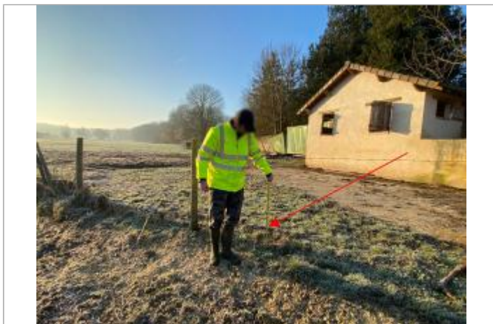
Vue site - Auteur : SYAGE