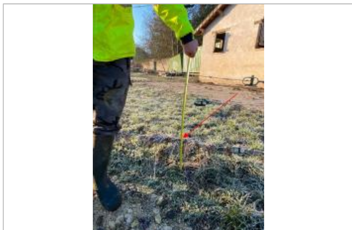
Vue marque - Auteur : SYAGE

Organisme(s) : SPC Seine moyenne - Yonne - Loing