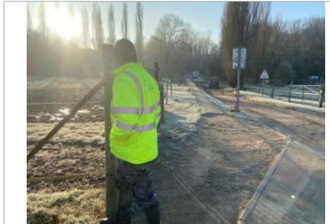
Vue site - Auteur : SYAGE