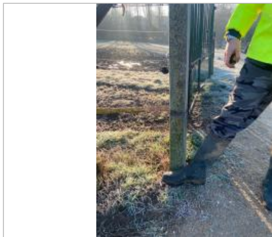
Vue marque - Auteur : SYAGE