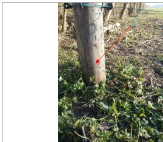
Vue marque - Auteur : SPC SMYL