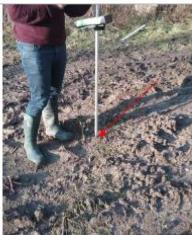
Vue marque