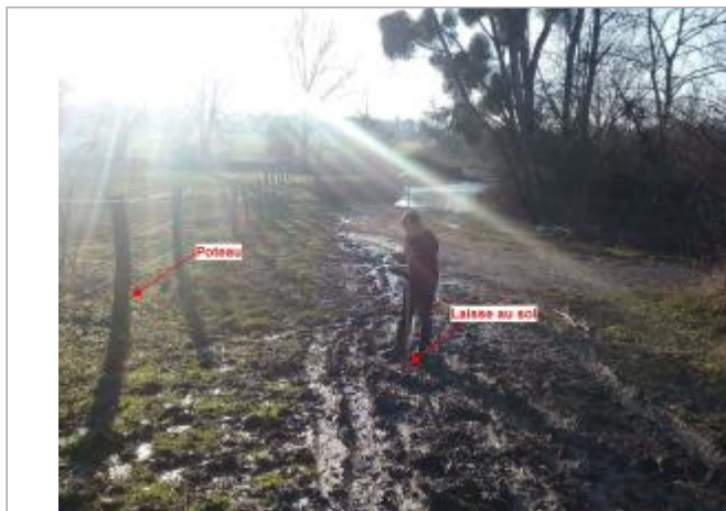
Vue site - Auteur : SPC SMYL