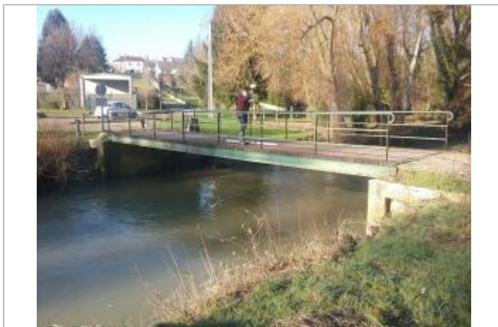
Vue site