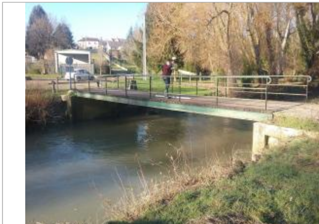
Vue site