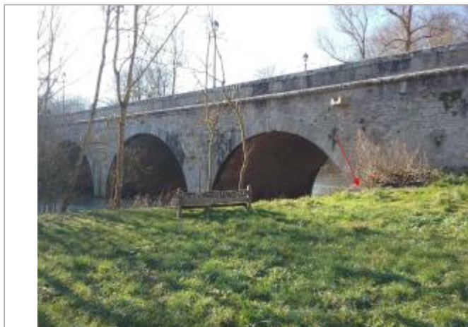
Vue site