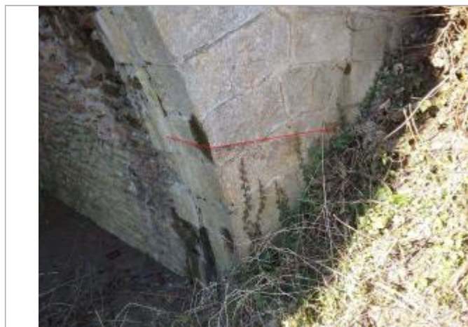
Vue marque - Auteur : SPC SMYL