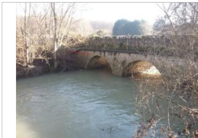
Vue marque - Auteur : SPC SMYL

Organisme : SPC Seine moyenne - Yonne - Loing