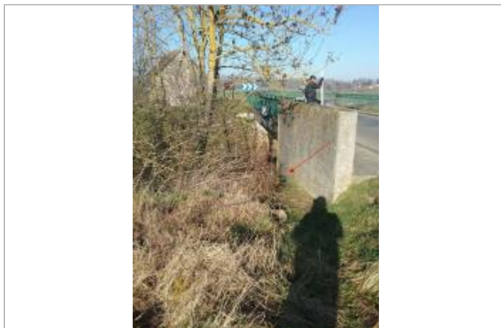
Vue site