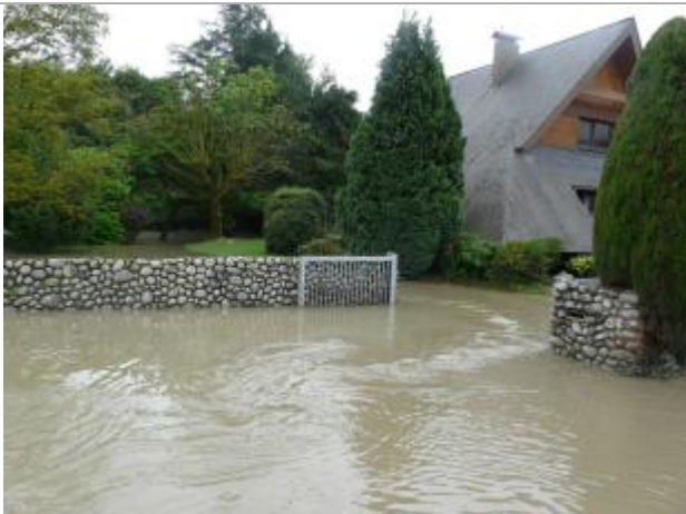
Crue liée à l'alimentation du Gabarret par le Gave