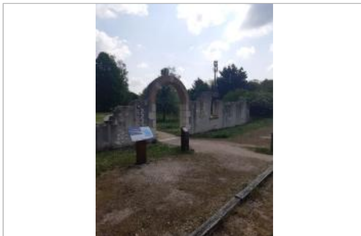
Vue du site en 2022